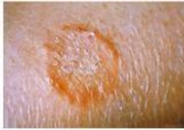
Ringworm on the arm