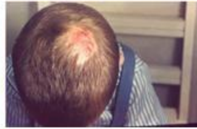
Ringworm on the scalp